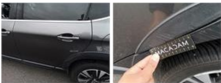
Jupe AR, Griffe(s), Peindre