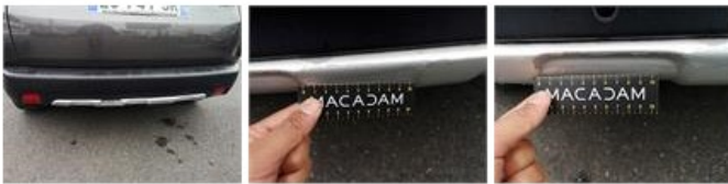
Pare-chocs AV, Dégrafé, N - Dépose/Répose