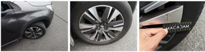
Porte ARD, Bosse(s), LI - Réparer et peindre (complet)