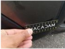
Moulure d'aile ARG, Déformé / Forcé, E - Remplacer