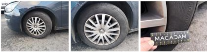
Obtrateur /Cache, Manque, E - Remplacer