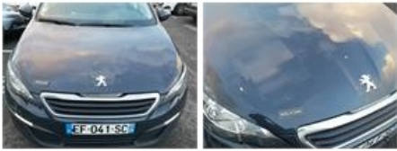
Pare-chocs AV, Eclat(s), Peindre