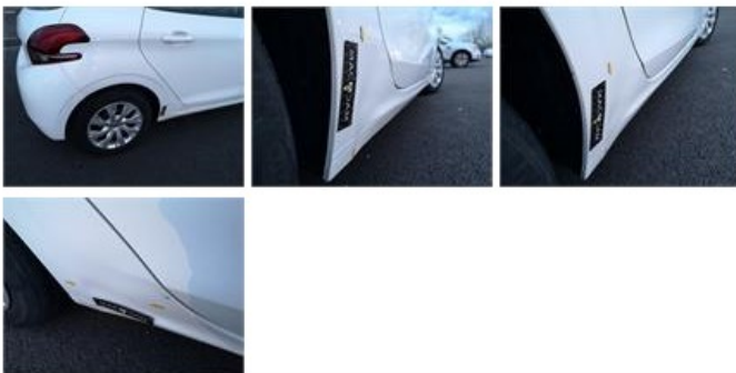
Porte ARD, Bosse(s) et griffe(s), LI - Réparer et peindre (complet)