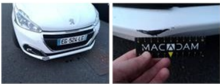
Bas de caisse ext D, Déformé / Forcé, LI - Réparer et peindre (complet)