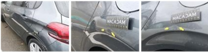
Bas de caisse ext G, Bosse(s) et griffe(s), LI - Réparer et peindre (complet)