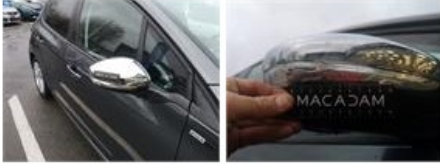
Aile ARG, Bosse(s), LI - Réparer et peindre (complet)