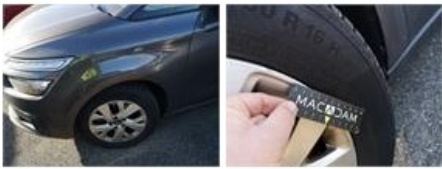
Pneu ARD, Hors tolérance, E - Remplacer