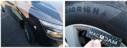
Entretien, Manque, Effectuer