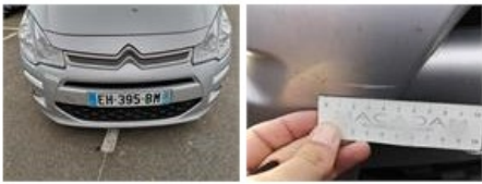
Aile AVD, Griffe(s), Peindre