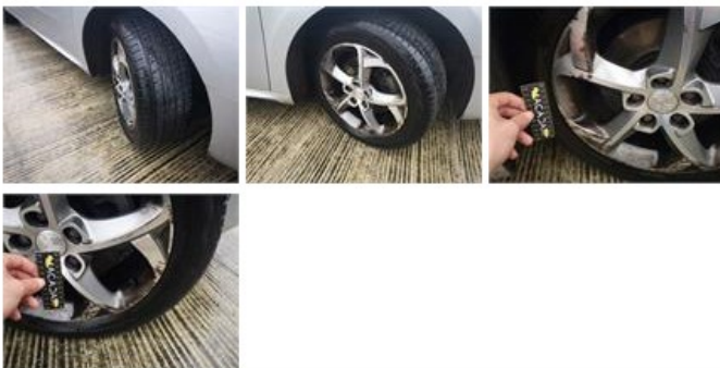
Jante alu ARD bitone/polychrome, Griffe(s), Réparer/remplacer (montant forfaitaire)