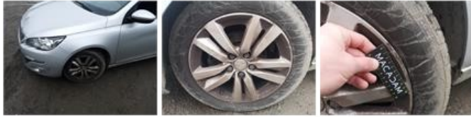
Jante alu ARD, Griffe(s), Réparer/remplacer (montant forfaitaire)