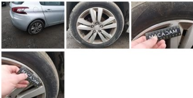
Jante alu ARG, Griffe(s), Réparer/remplacer (montant forfaitaire)