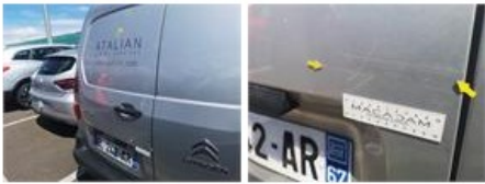
Porte coulissante D, Bosse(s) et griffe(s), LI - Réparer et peindre (complet)