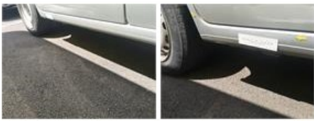
Carrosserie, Pas d'origine, Délettrage