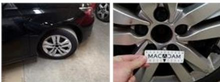
Jante alu AVG, Griffe(s), Réparer/remplacer (montant forfaitaire)