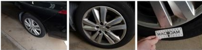
Jante alu ARD, Griffe(s), Réparer/remplacer (montant forfaitaire)