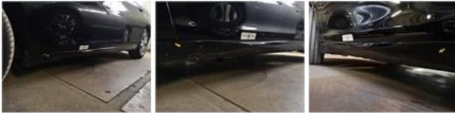
Jante alu ARG, Griffe(s), Réparer/remplacer (montant forfaitaire)