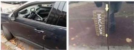
Porte ARD, Griffe(s), Acceptable