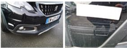
Ciel de toit, Trou, E - Remplacer