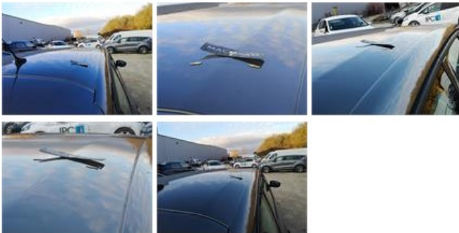
Montant de toit D, Bosse(s), Acceptable