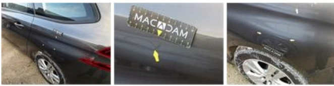
Jante alu AVG, Griffe(s), Réparer/remplacer (montant forfaitaire)