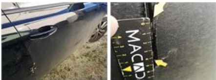
Aile ARG, Griffe(s), Lustrage