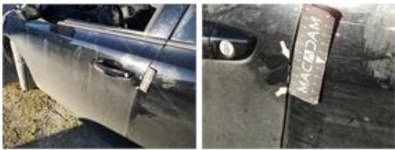
Porte AVD, Griffe(s), Réparer/remplacer (montant forfaitaire)