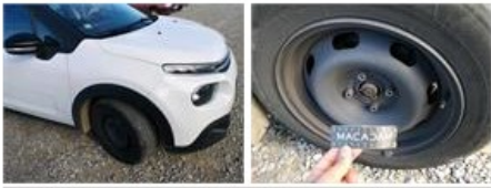
Enjoliveur de roue AVG, Cassé, E - Remplacer