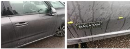
Bas de caisse ext D, Bosse(s) et griffe(s), Le - Remplacer et peindre