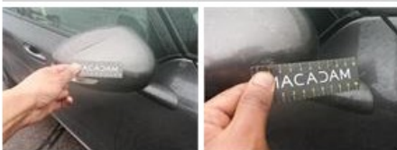
Porte AVG, Griffe(s), Réparer/remplacer (montant forfaitaire)