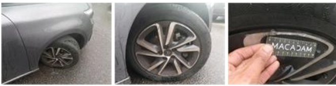
Jante alu ARD bitone/polychrome, Griffe(s), Réparer/remplacer (montant forfaitaire)