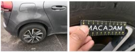
Porte AVD, Griffe(s), Peindre