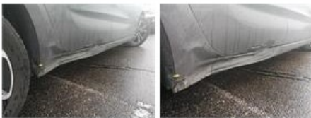
Bas de caisse ext G, Bosse(s) et griffe(s), LI - Réparer et peindre (complet)