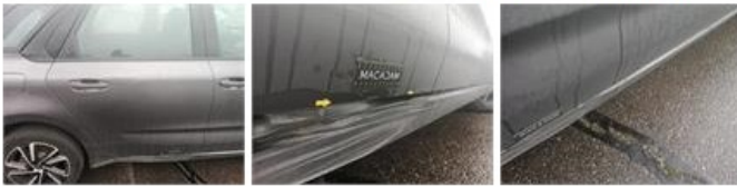
Jante alu ARG bitone/polychrome, Griffe(s), Réparer/remplacer (montant forfaitaire)