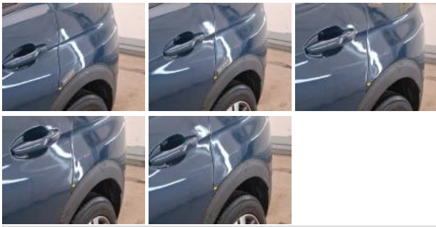
Porte ARG, Mauvaise réparation, Peindre