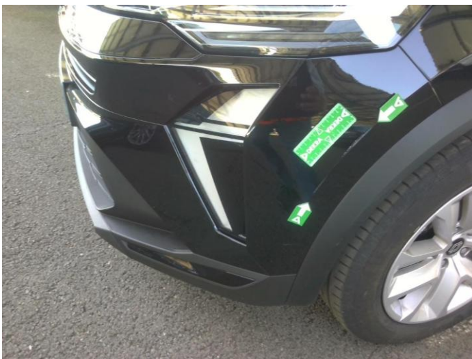
1. Haut de Pare-choc