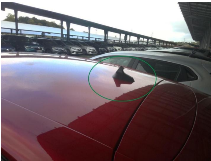
2. Brin d'antenne